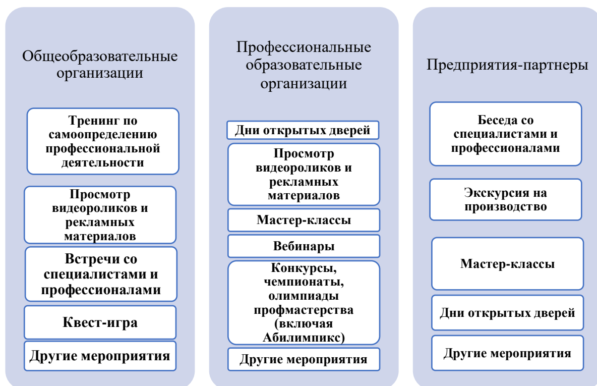
Рис. 2. Основные мероприятия профориентации обучающихся с ограниченными возможностями здоровья и инвалидностью

профессионального образования, в том числе и непосредственно работодателями, которые могут предоставить непосредственное и четкое представление о профессиональной деятельности. Таким образом, можно представить мероприятия по профориентации лиц с инвалидностью и ОВЗ в следующем виде (см. Рис 2.):